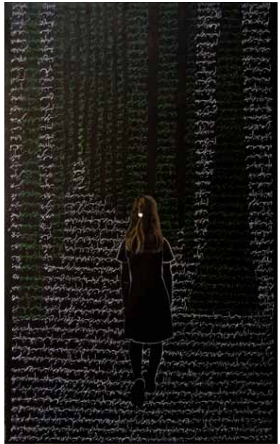
Katâyoun Rouhi, Où est la demeure de l'ami, 2010, 81 x 130 cm

comme pour signifier l'importance des propos sous-jacents, de l'allégorie. « Pendant la répression, la poésie permettait de dire beaucoup de chose », précise l'artiste. La figure de l'enfant, mélange de la fille de l'artiste et d'elle-même enfant, est représentée de dos, permettant ainsi de s'y identifier. Elle devient alors une figure générique, atemporelle. L'arbre symbolise lui aussi la quête d'identité. Est-ce l'arbre de la vie, l'arbre du savoir, l'arbre généalogique, l'arbre cosmique ? « Tout le monde peut y voir ce qu'il veut. Mais dans la poésie persane, il est un point de repère. Et dans mon enfance, on s'orientait dans la nature à partir