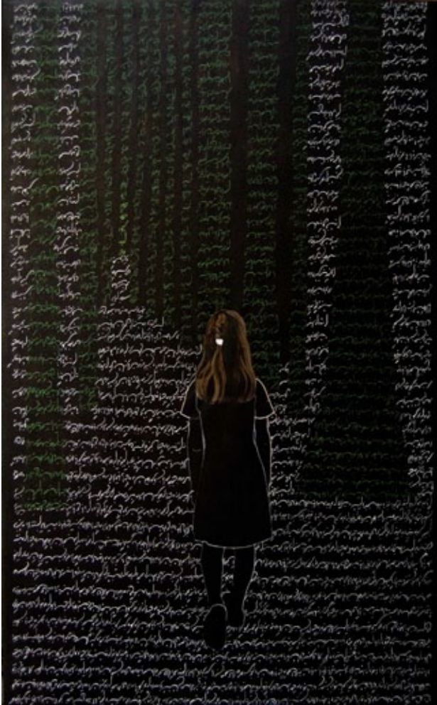
Où est la demeure de l'ami, 2010 collage and oil on canvas, 130 x 81cm