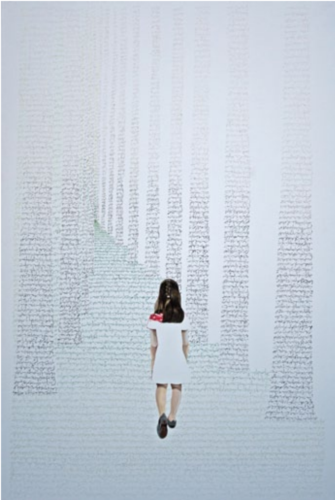
Vers le non-où, 2011 oil on canvas, 195 x 130 cm