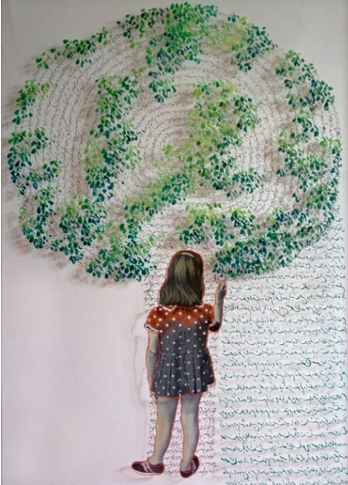
Ut poesis pictura, 2012 oil on canvas and plexiglass, 122 x 87 cm