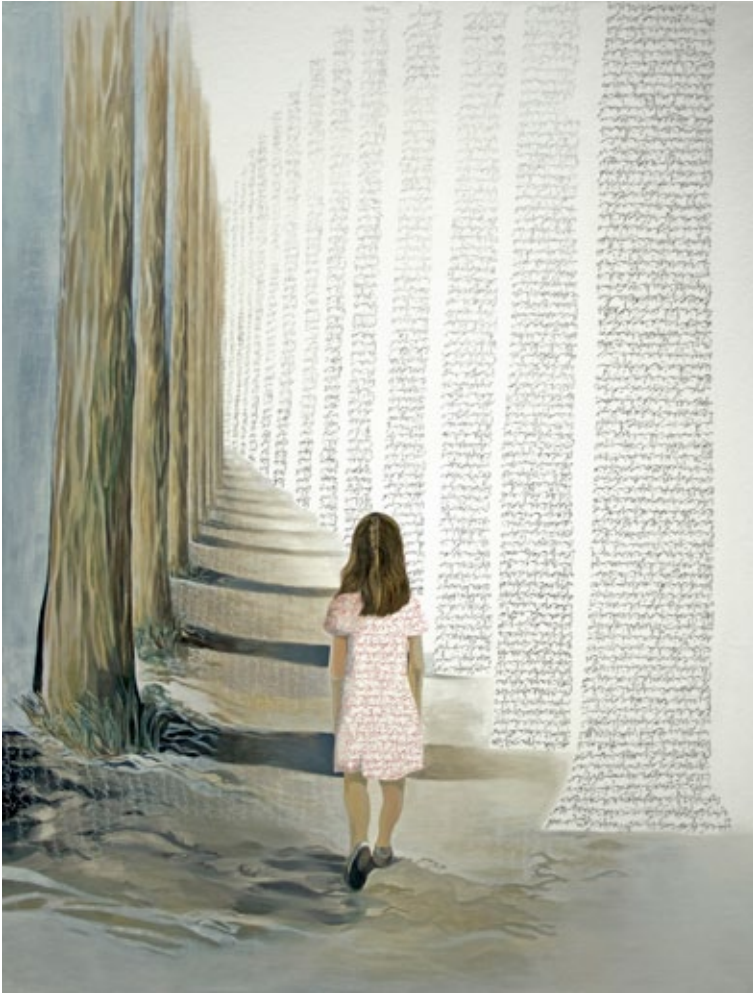
Vers le non-où, 2010 oil on canvas, 162 x 130 cm