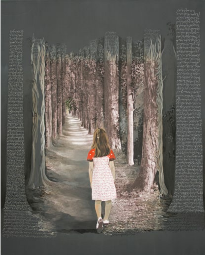
Vers le non-où, 2011 oil on canvas, 162 x 130 cm