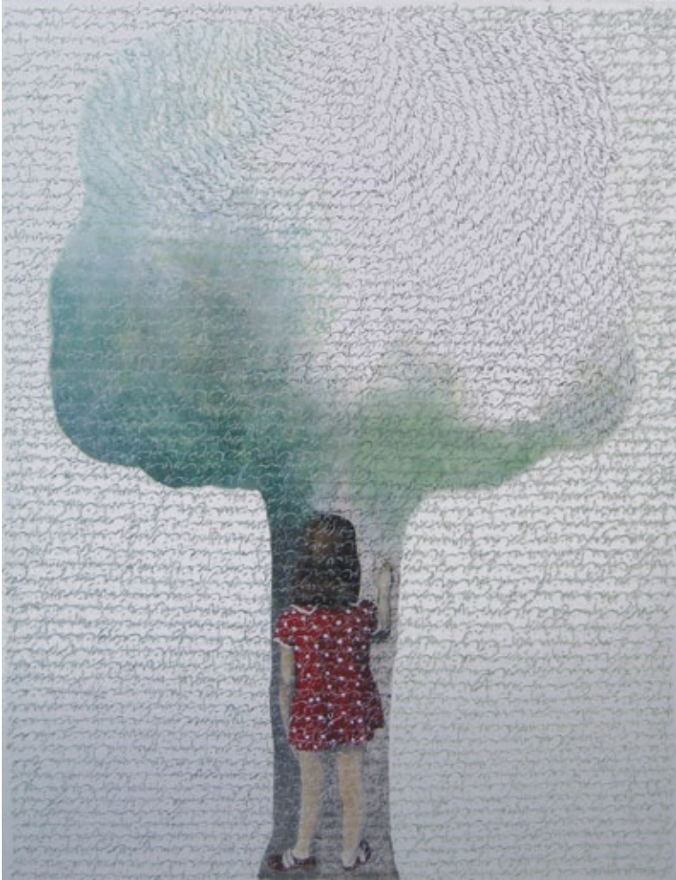
Ut poesis pictura, 2009 oil on canvas, 100 x 80 cm