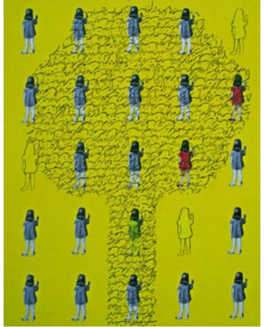
Ut poesis pictura, 2008 oil on canvas, each 50 x 40 cm