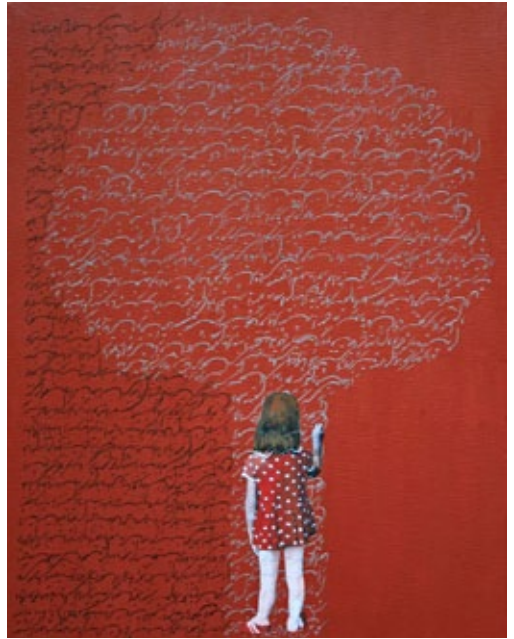
Ut poesis pictura, 2008 oil on canvas, each 50 x 40 cm