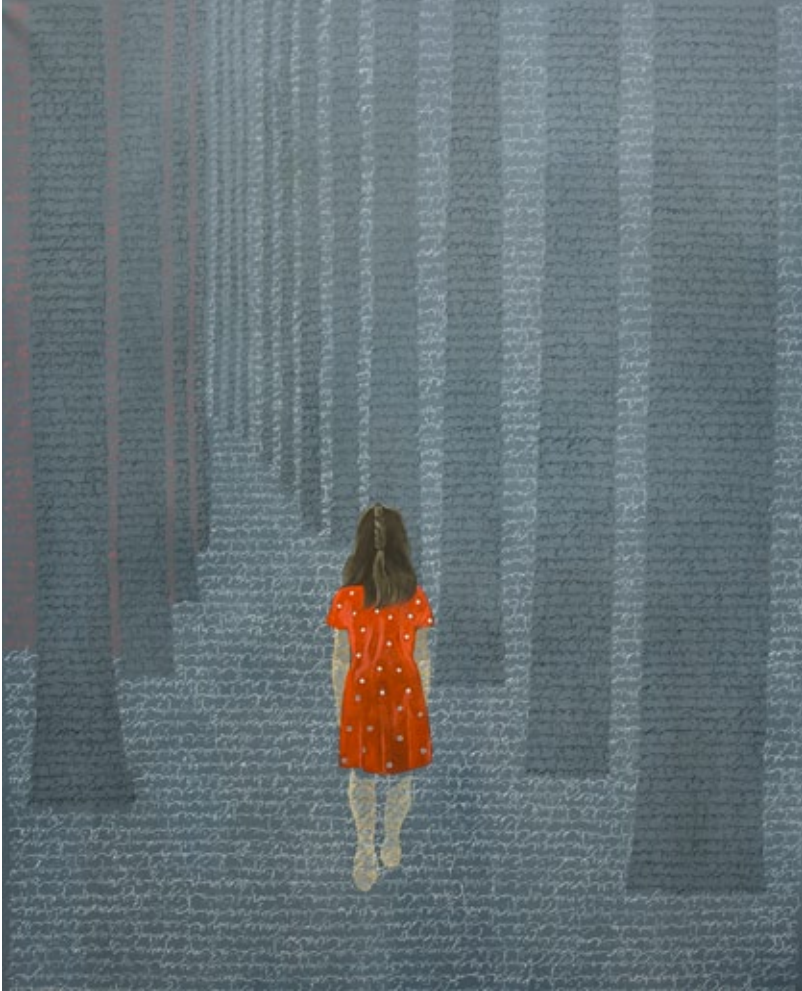
Vers le non-où, 2011 oil on canvas, 162 x 130 cm