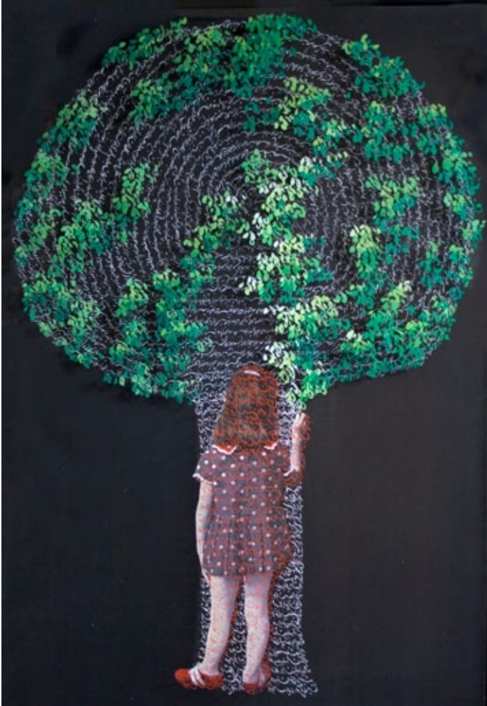
Ut poesis pictura, 2012 serigraphy and oil on canvas and plexiglass, 122 x 87 cm